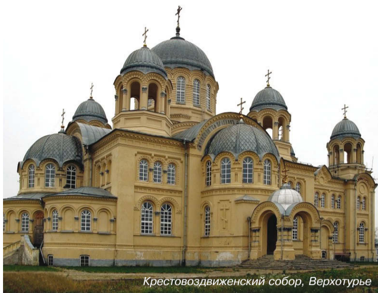
Крестовоздвиженский собор, Верхотурье

«Воссиял еси светлостью чудес Твоих праведный Симеоне...»