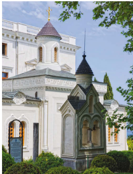
Рядом с дворцом находится церковь Воздвижения Креста Господня . Придворный архитектор Монигетти создал

На летних каникулах я ездила в Крым, где посетила одно из самых известных мест: Ливадийский дворец (летнюю резиденцию русских царей: Александра II, Александра III и Николая II). Для Николая II Ливадия была любимым местом отдыха. Отдых семьи последнего российского самодержца прост и размерен: поездки верхом и пешие прогулки в горы и к водопаду Учан-Су, чтение книг и журналов, фотография: этим увлечением болели как сам Николай (достаточно талантливый фотограф и неплохой художник), так и его дочери. Немного позже к развлечениям добавились семейные поездки по Крыму в автомобиле.