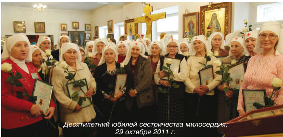
Десятилетний юбилей сестричества милосердия, 29 октября 2011 г.