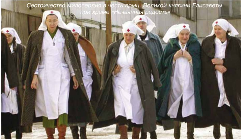
Сестричество милосердия в честь прмц. Великой княгини Елисаветы при храме «Нечаянная радость»

Служить призвал нас Господь, омыв ноги апостолам на тайной вечере. Милосердное бескорыстное служение ближнему, пожалуй, можно назвать средством гарантированного спасения. Милосердие – это жемчуг, жаль, что люди в жизни зачастую интересуются не им, а дешёвыми побрякушками. Но среди нас есть исключение – это сёстры милосердия.