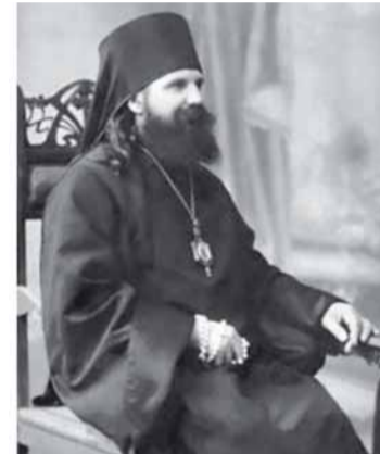
Возвращение на родину

Преследования, обыски, неоднократные покушения на убийство – всё это пережил архиепископ Иоанн. Его неоднократно арестовывали, судили, собирались расстрелять, но всякий раз отпускали на свободу за недоказуемостью состава преступления... Хотя мы знаем, что для обвинения и расстрела советской власти было достаточно уже того, что человек мог бы совершить контрреволюционного. Видимо, Господь хранил праведника для дальнейшего исповедничества. А тяжкие испытания только укрепили духовные силы Владыки.